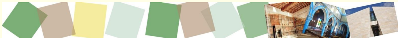
Synagogue de Djerba, Tunisie, 19 e siècle