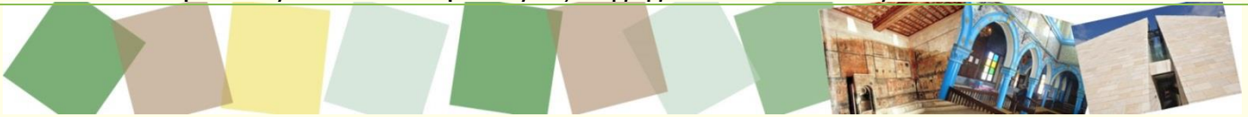
Synagogue de Florence, Italie, 1874